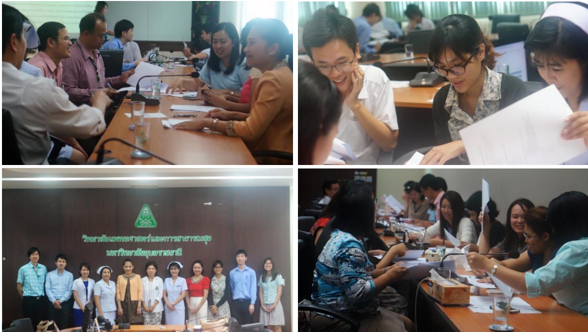
ภาพกิจกรรมการประชุมเพื่อแลกเปลี่ยนเรียนรู้เรื่อง It's time to change

โดยอาจารย์แต่ละท่านได้สรุปการประยุกต์ใช้หลักการเรียนรู้แห่งศตวรรษที่ ๒๑ ให้เข้ากับหลักการอบรม การพัฒนาตนเองได้